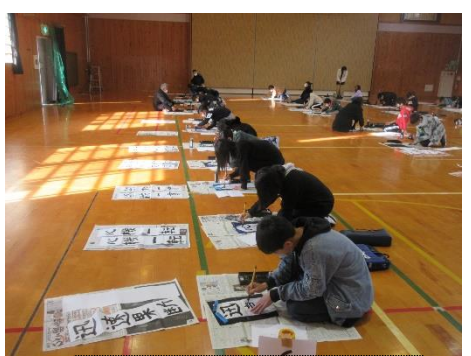
書き初め大会（体育館）