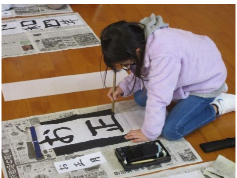
書き初め大会（4年生）