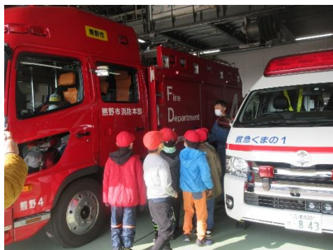
熊野市消防本部見学（3年生）