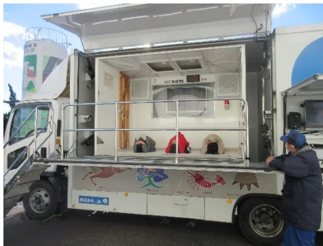
防災学習（地震体験）