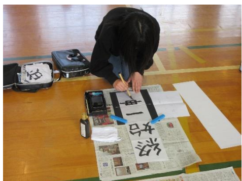
書き初め大会（6年生）