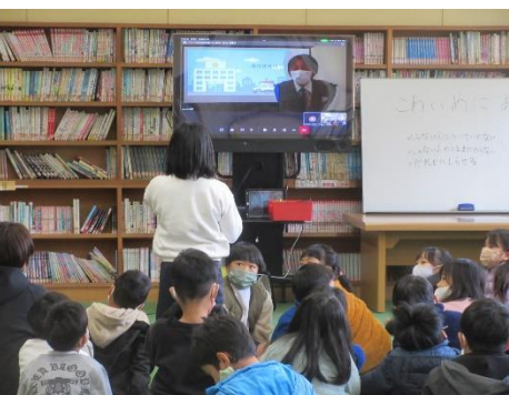
防犯教室（オンライン）