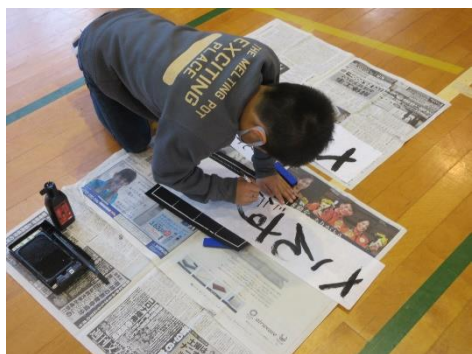
書き初め大会（3年生）