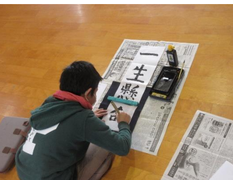
書き初め大会（5年生）