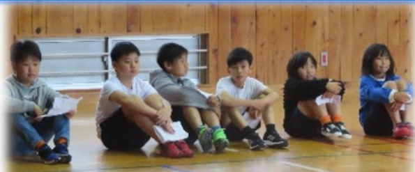
選挙管理委員のみなさん