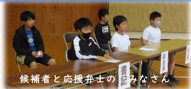
候補者と応援弁士の書記のみなさん

前期委員会のメンバーも決まり、4年生以上の子ども達が主体的に行動しながら活動を進めていきます。各ご家庭で子ども会や委員会での活動の様子をぜひ聞いてあげてください。